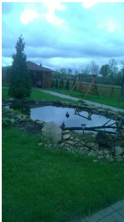
Widok z podwórka