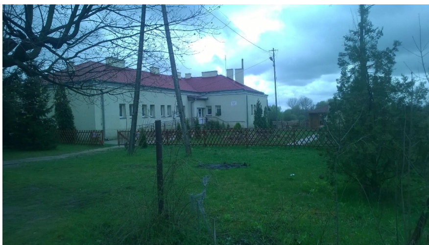
Fot. Agnieszka Stochmal; Dom Pomocy Rodzinnej „Przystań”

Profesjonalna opieka medyczna, komfort i bezpieczeństwo to coś, czego życzymy naszym seniorom. Niestety, nie każdy ma możliwość zapewnienia tego swoim bliskim w rodzinnym domu. Powody są różne: brak czasu, możliwości finansowych, wyjazdy do pracy za granicę, czy choroby bliskich. Nie zmienia to jednak faktu, że życzymy rodzinie jak najlepiej. Dlatego często decydujemy się na umieszczenie osoby starszej w odpowiedniej placówce, gdzie będzie miała zapewnioną właściwą opiekę.