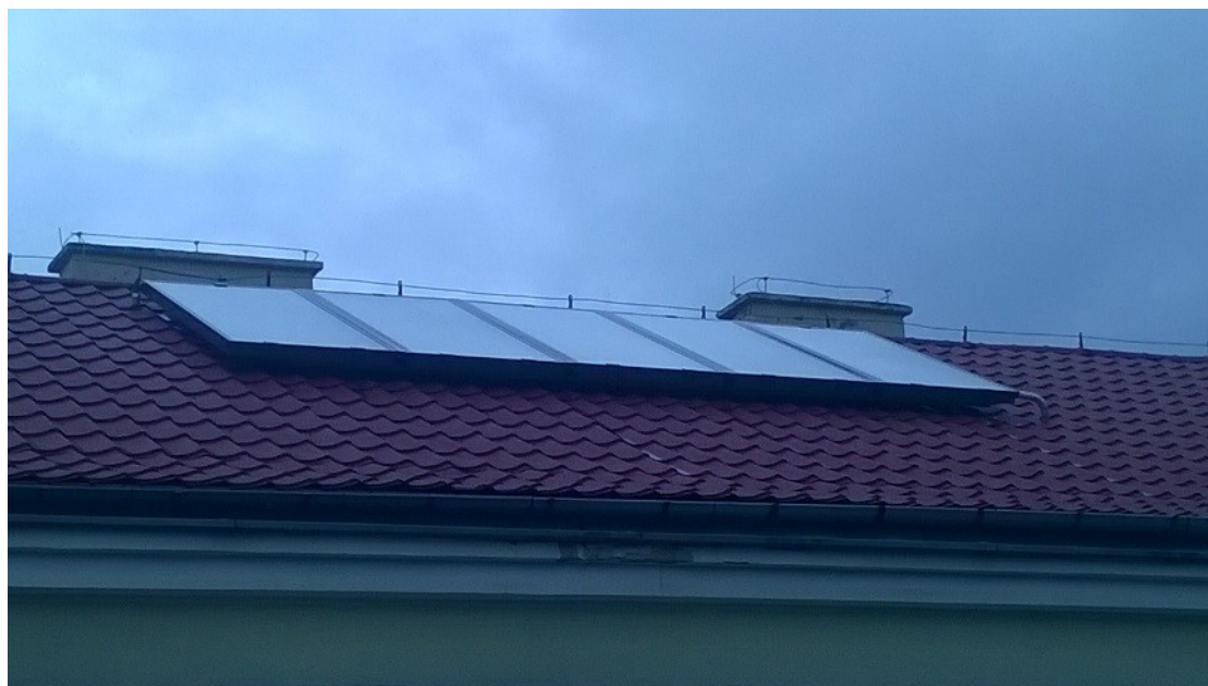
kolektory słoneczne

Na dachu zamontowano także kolektory słoneczne. Są to urządzenia, które poprzez czerpanie energii słonecznej nagrzewają wodę w bojlerze. Jest to bardzo oszczędne i ekologiczne rozwiązanie.