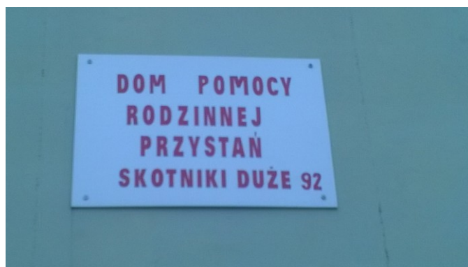
Tablica z nazwą ośrodka